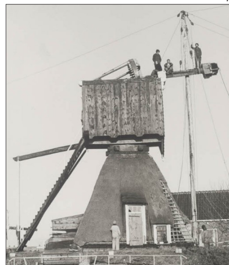
het steken van de bovenas