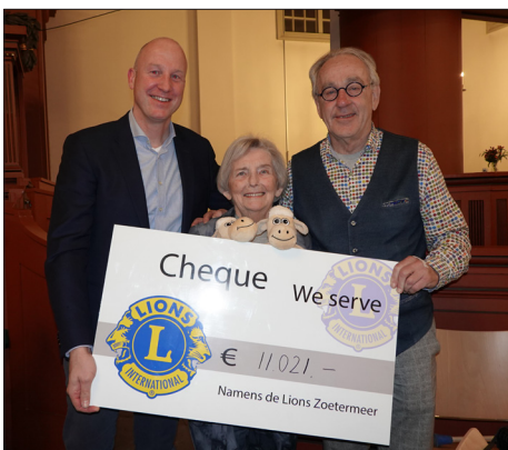
afvaardiging van ons bestuur (november 2022)

Elders in dit MolenNieuws leest u meer over deze verbetering. Dankzij de gulle donatie van de Lions konden wij deze realiseren.