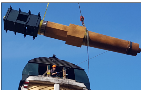
voorbeeld houten bovenas

Vroeger werd een bovenas van hout gemaakt. Hiervoor was een zware eiken stam nodig van circa 75x75 cm en een meter of 6 lang. Op twee plekken werd de as rond gemaakt als lager om te kunnen draaien, ter bescherming werden er ijzeren strippen ingehakt. De gaten in die in de askop werden gestoken voor de wieken, verzwakten de as natuurlijk behoorlijk. Bovendien zit deze askop altijd in weer en wind en gaat na verloop van tijd rotten. Een gemiddelde levensduur voor een bovenas was hierdoor maximaal een jaar of 30.